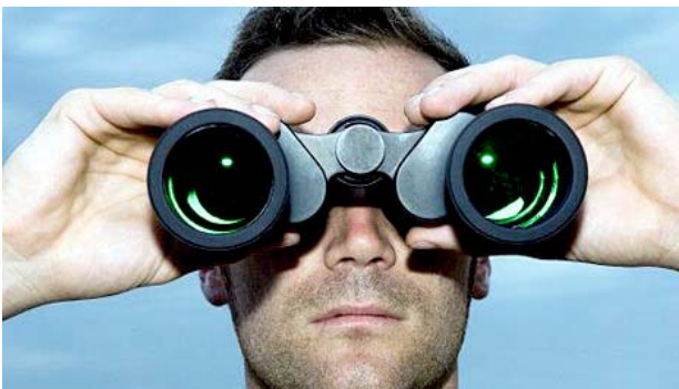
Als je voor je kijkt, zie je achter je niets!

Hoe speelt focus hierin een rol? Natuurlijk had ik een doel nodig om in de juiste richting te vertrekken. Echter, wanneer je focust op het zakelijke, dan is er per definitie minder focus voor het persoonlijke. Focus op een doel heeft als pluspunt dat je zelf de regie kunt nemen in het bereiken daarvan. De keerzijde is dat met (te)veel focus er minder aandacht is voor al datgene waar je zelf geen regie op kunt voeren; datgene wat op je pad komt. Zoals een verlies waar ik in 2010 mee geconfronteerd werd. Of de economische situatie die het momenteel niet echt gemakkelijk maakt voor ondernemers.