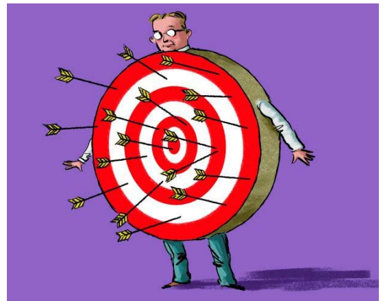
Datgene wat jij niet aanstuurt, stuurt jou aan!

Acht jaar geleden raakte ik geïnspireerd over de mogelijkheden van coaching en wat je hiermee kunt bereiken. Dat was op een moment dat ik wat vastliep in mijn toenmalige werk en een fantastische coach liet mij zien waar het knelde en waar ik de oplossingen kon vinden om verder te groeien. Op dat moment werd ergens in mij een coach geboren. Echter, ik had een managersfunctie bij een waterschap en beschikte vooral kennis en vaardigheden in de techniek. Ik wist niets over mensen en hun gedrag. Laat staan over hoe je door het aanpassen van je communicatie gewenste veranderingen kunt doorvoeren.